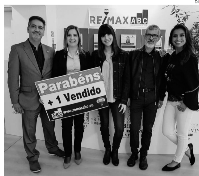
Equipa da “RE/MAX ABC” e da TVI

“Querido, comprei uma casa!” Estreia da nova temporada do programa foi vista por mais de 890.000 espectadores