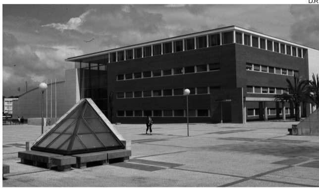
Evento de criação de “startups” terá lugar no campus da UA

DE 22 A 24 Aveiro receberá, pela primeira vez, entre os próximos dias 22 e 24, o “Startup Weekend”, considerado “o maior evento de criação de startups do mundo”, que tem como objectivo “fomentar e difundir os empreendedores e a inovação tecnológica”.