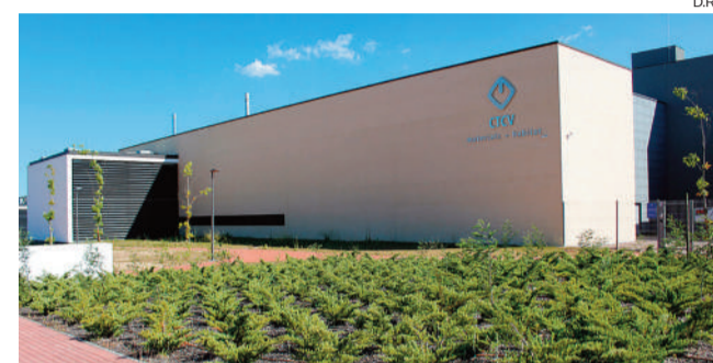
Esclarecimentos no Centro Tecnológico da Cerâmica e do Vidro

FUNDO Foi lançado um Fundo de Apoio às Pequenas e Médias Empresas (PME), “Ideas Powered for Business SME Fund”, no valor de 20 milhões de euros, destinado a ajudar as PME sediadas na União Europeia a aceder e beneficiar dos seus direitos de propriedade intelectual (DPI), com o objectivo de reforçar a sua competitividade no mercado e, também, para combater o impacto negativo causado pela pandemia de Covid-19 nas PME europeias.