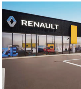
Criação de unidade de raiz

De referir que a nova concessão do grupo em Leiria, levou à criação de uma unidade de raiz, com um investimento de três milhões de euros, na construção da instalação integrada de 14.500m 2 dos quais 5.500m 2 de área coberta. Dis-