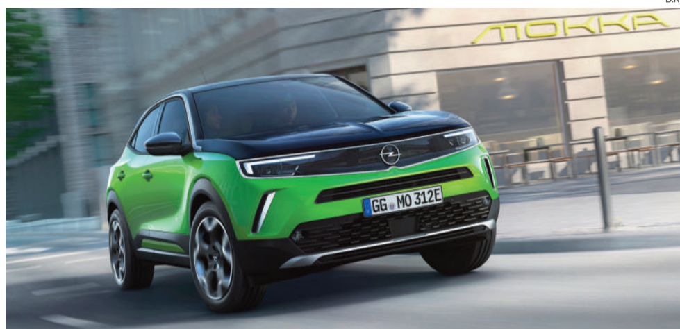
“A Opel é eléctrica” é o mote do fabricante alemão

O portefólio engloba desde o sub-compacto “best-seller” eléctrico Opel Corsa-e até ao pioneiro e novíssimo Opel Mokka-e, passando pelas propostas Opel Vivaro-e e Opel Zafira-e Life, para além do Opel Grandland X, uma sofisticada proposta híbrida “plug-in”. Forte capacidade de aceleração e autonomias até aos 337 quilómetros (Corsa-e) em ciclo WLTP tomam os automóveis eléctricos da Opel especialmente dinâmicos e totalmente adequados para uma utilização no dia-a-dia. Além disso, a Opel oferece uma ampla escolha de