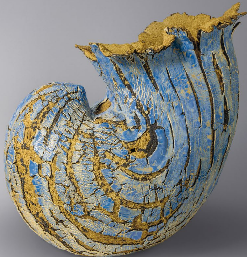
Caelles (Lourdes Riera Rey), Eclosion, 2015